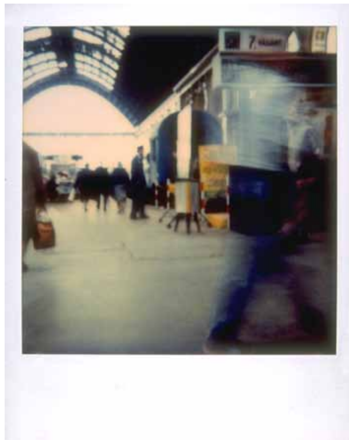
Orient Express Polaroid N° 2 du retour Budapest-Paris