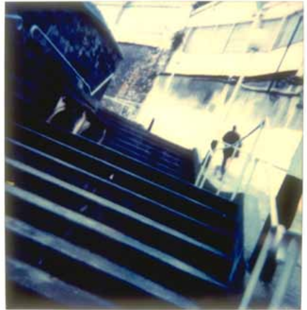
Orient Express Polaroid N° 24 Budapest-Paris