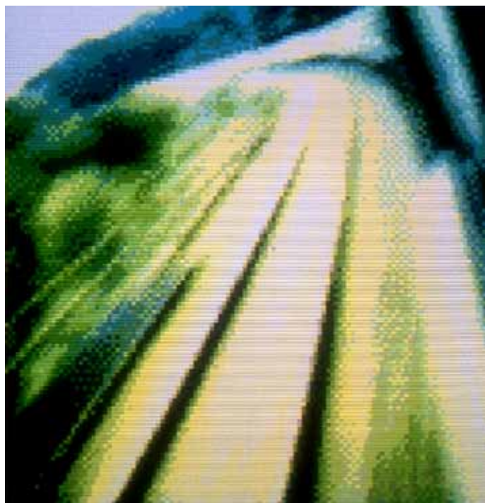
Orient Express Polaroid numérisé N° 15 de l'aller Paris-Budapest

« I love Zsafia », graphiti des murs de Budapest.