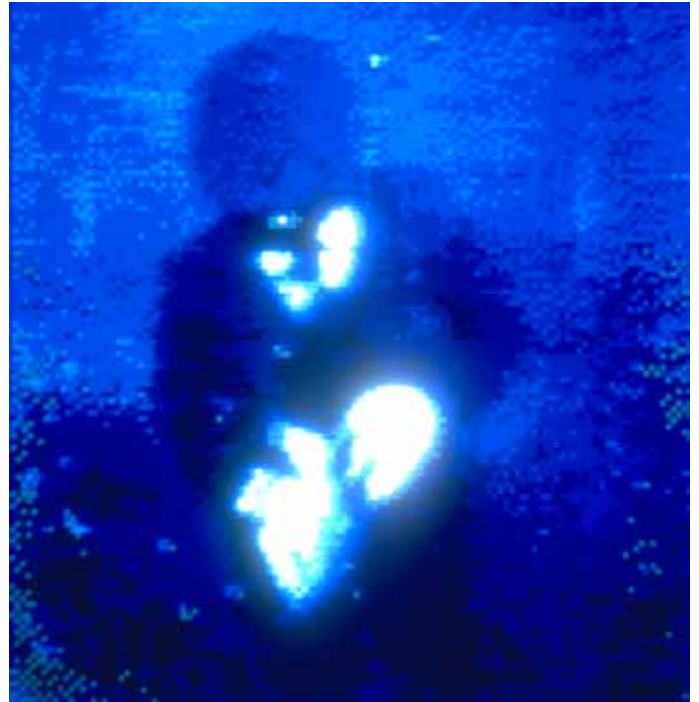
Orient Express Polaroid numérisé N° 9 du retour Budapest-Paris